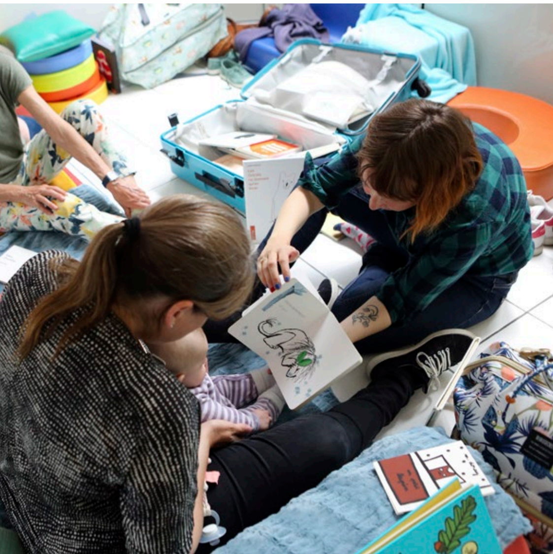
Séance de lecture partagée à la PMI de Douvres avec l'association Matulu (14)