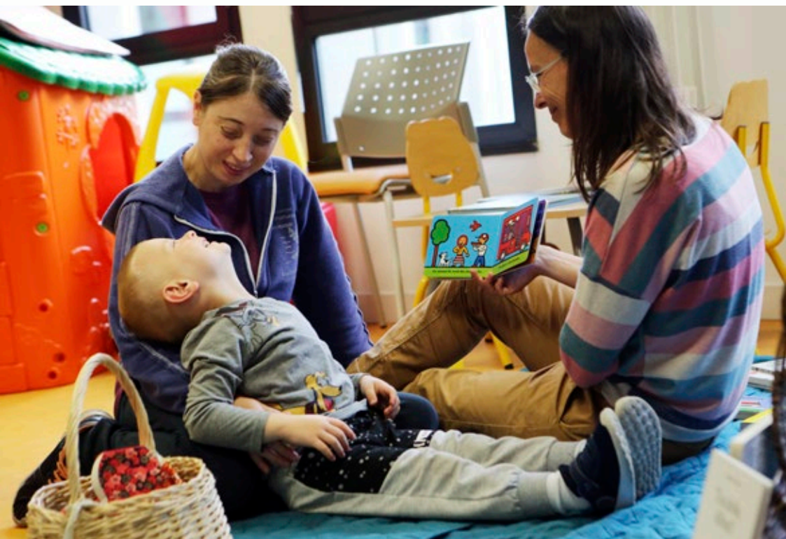
Séance de lecture partagée à la PMI de Vannes avec l'association Tribu en filigrane (56)