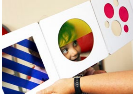
Séance de lecture partagée à la PMI de Malestroit avec l'association Tribu en filigrane (56)

Certains albums font immédiatement réagir : « Oh, je ne savais pas qu'il y avait d'aussi beaux livres pour les enfants ! ». Les tout-petits sont très sensibles aux détails, aux images, à la musicalité et au rythme des textes. Ils sont souvent attentifs aux récits longs ou complexes, il est donc important de ne pas se limiter aux histoires brèves. Ni aux albums cartonnés car les tout-petits aiment tourner les pages. Vaste sujet que la constitution des caisses, paniers et autres valises d'albums, qui s'appuie sur les qualités des œuvres et sur l'expérience des lecteurs membres du comité de pilotage constamment mise à jour au fil des rencontres. Ce choix est à réinterroger sans cesse, entre classiques indémodables et nouveautés à découvrir.