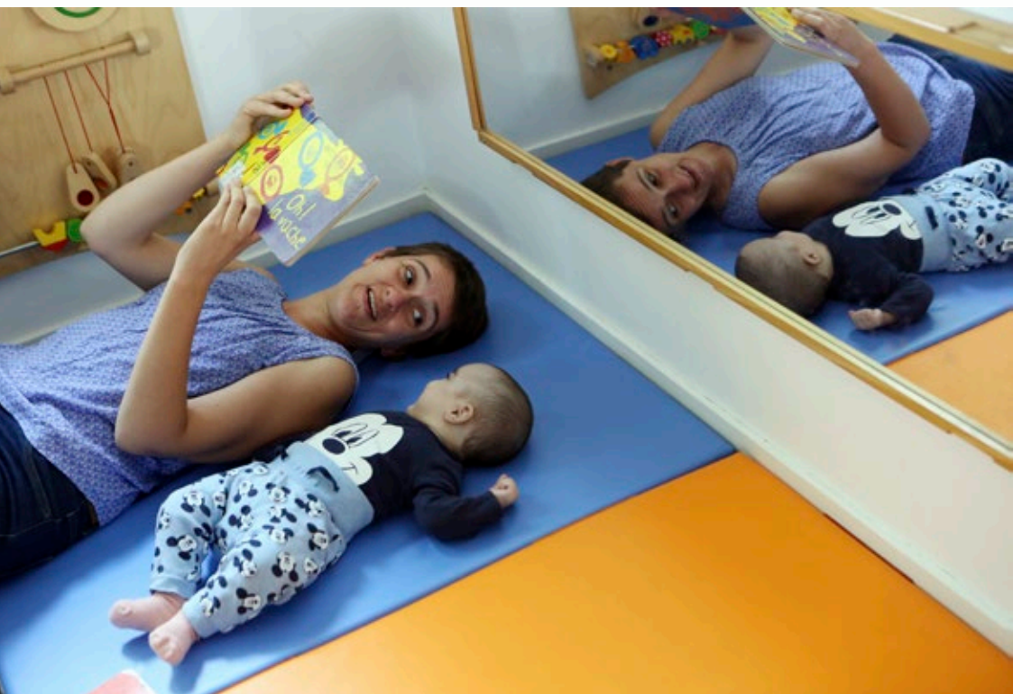
Séance de lecture partagée à la PMI du Sanitas à Tours avec l'association Livre Passerelle (37)